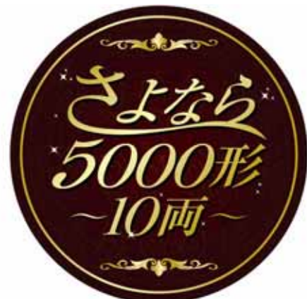
「5000形10両さよなら運行」 記念ヘッドマーク