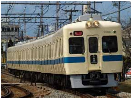
引退する5000形6両編成